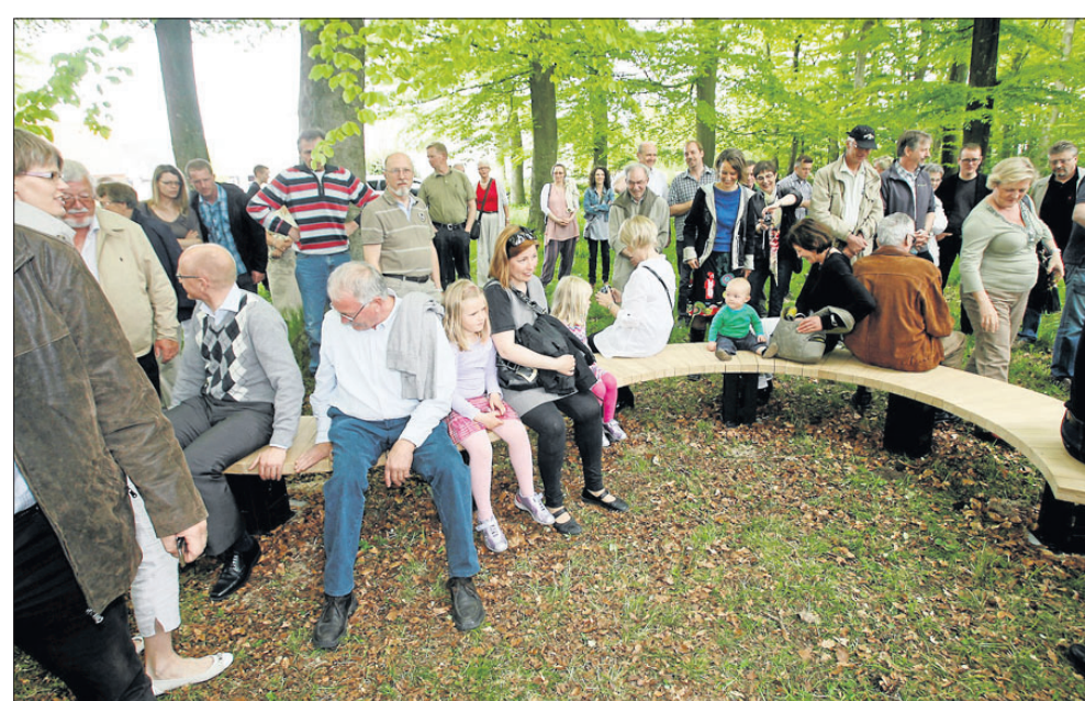
Tre »Flow« bænke sat sammen blev straks efter afsløringen taget i brug af gæster i alle aldre.

Det fantastiske er, at da de mægtige, massive pæle blev trukket op ad havnen, viste det sig, at kernen var af det fineste intakte fyrretræ, saltvandsimpræget og holdbart langt ind i fremtiden! Så de 275 bænke, der laves i denne lukkede serie, vil kunne tåle